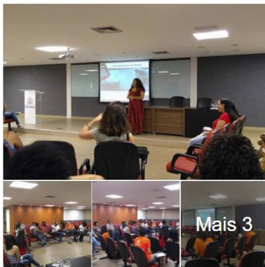
Ocupa a Mídia adicionou 6 novas fotos. Publicado por Samantha F Souza (P) · 29 de novembro de 2017 · Hoje está acontecendo: 28ª capacitação de redes. Roda de conversa : Experiência Midiáticas nas lutas pelos Direitos Humanos. Ocupa Mídia!!!

O coletivo Ocupa Mídia e a ISF-B foram convidados pelo núcleo de extensão “ Articulando redes, fortalecendo comunidades ” ( PUC Minas, psicologia) para apresentar sua experiência em dialogo com um trabalho comunitário realizado pelo núcleo.